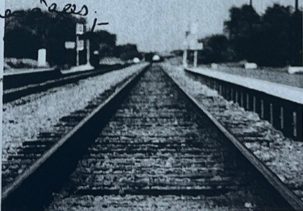
La voie/Les rails