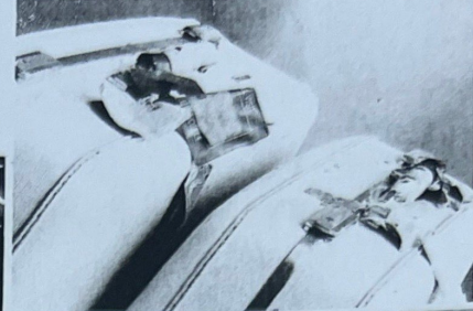
Les valises (les bagages)